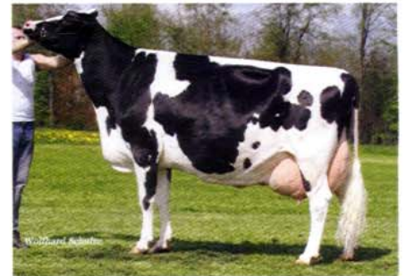
Questos Mutter: Ruegruet Jolt Quittance VG-89.